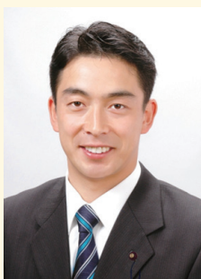
20年前のポスター写真

地域の声に耳を傾け、市民の暮らしに寄り添う政治を胸に、皆さまと共に歩んできた20年でした。いただいたご意見や励ましが私の活動の原動力です。これからも初心を忘れず、旭区そして横浜市の未来のために、全力で取り組んでまいります。今後とも温かいご指導とご支援を賜りますよう、よろしくお願い申し上げます。