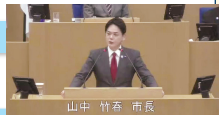
山中 竹春 市長