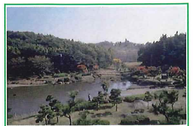
<こども自然公園/二俣川駅から徒歩15分>

旭区を中心とする相鉄線沿線地域は横浜市の郊外部に位置しており、都心臨海部に比べて、人口減少や急速な高齢化が進んでいます。一方で閑静な戸建住宅地が多く、良好な住環境が維持されているうえ、樹林地・農地等豊かな自然に恵まれるなど都心にはない魅力もあります。相鉄・東急直通線の開業によって交通利便性が向上し、都市と自然をつなぐ住みやすい地域となることで子育て世代の転入が促進され、幅広い年齢層の居住による沿線地域の活性化が期待されています。