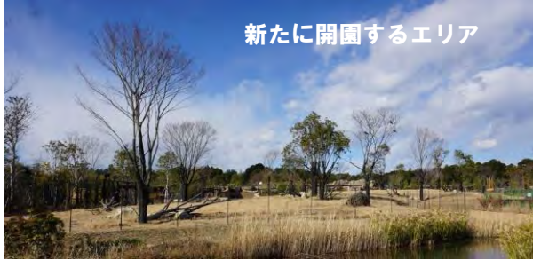
新たに開園するエリア

旭区の人気スポットである「よこはま動物園ズーラシア」は平成 11 年に「生命の共生・自然との調和」をメインテーマに開園しました。開園以来、市内・外から多くの来園者を受け入れ、H27 年 1 月末には累計入園者数が 1,800 万人を突破するなど、子供から大人まであらゆる世代の方々に親しまれています。このたび、新規整備が進められてきた「アフリカのサバンナ」エリアが 4 月 22 日に全面開園します！この新エリアは広大な草原や湿地など東アフリカのサバンナの景観を再現した約 4.6ha のエリアです。初めての方も既に行ったことのある方も、ぜひ「本物のアフリカ」を体感してみてください！