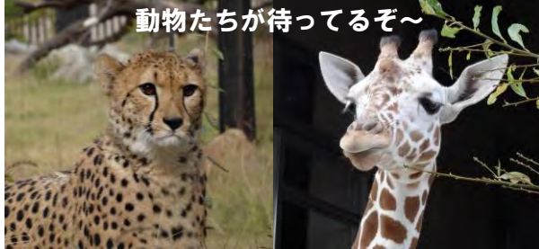
動物たちが待ってるぞ～