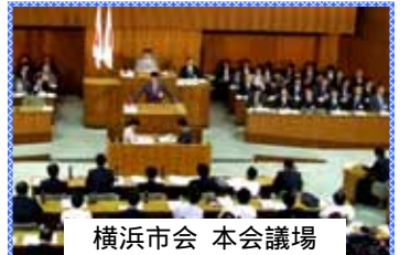
横浜市会 本会議場