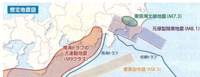
(「想定地震図」横浜市 HP より)