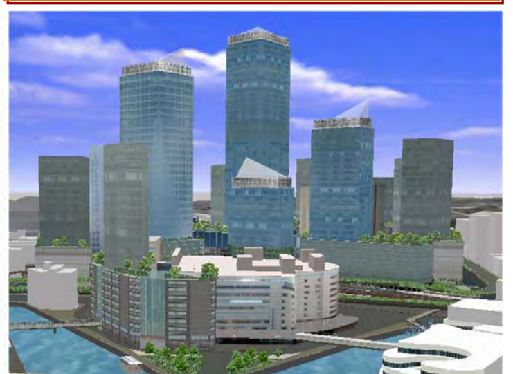
概ね20年後の横浜駅周辺(イメージ)